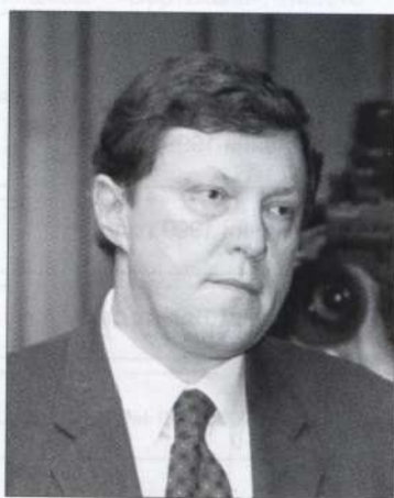
ЯВЛИНСКИЙ Григорий Алексеевич депутат Государственной Думы, руководитель фракции «Яблоко», лидер партии «Яблоко»

1. Дата выдвижения и регистрации инициативной группы в Центризбиркоме РФ