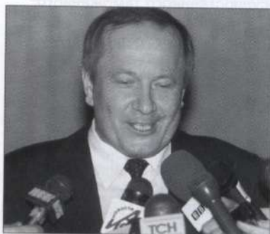
СКУРАТОВ Юрий Ильич временно отстраненный от должности Генерального прокурора РФ

Финансирование кампании Е.Савостьянова осуществляется в основном за счет средств Фонда, который он и возглавляет.