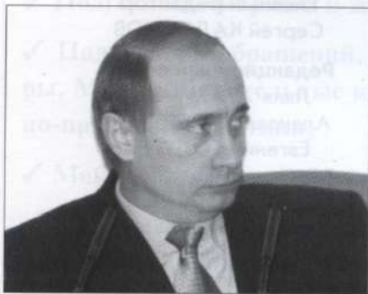
ПУТИН Владимир Владимирович и.о. Президента РФ, председатель Правительства РФ