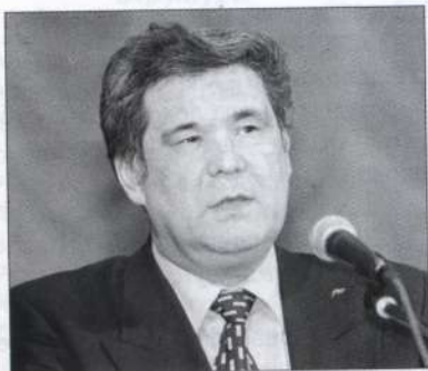
ТУЛЕЕВ Аман-гельды Молдагазыевич губернатор Кемеровской области

1. Дата выдвижения и регистрации инициативной группы в Центризбиркоме РФ